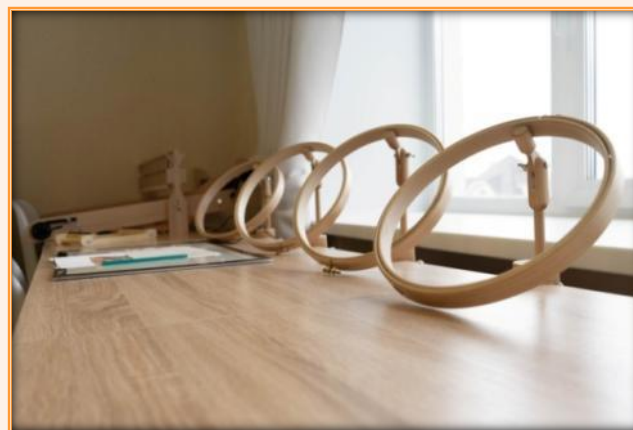
Настольные пальца для ручной вышивки