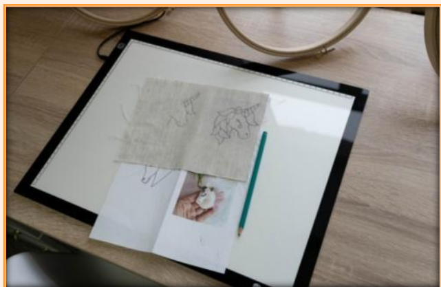
Графический планшет для перевода рисунков для вышивки