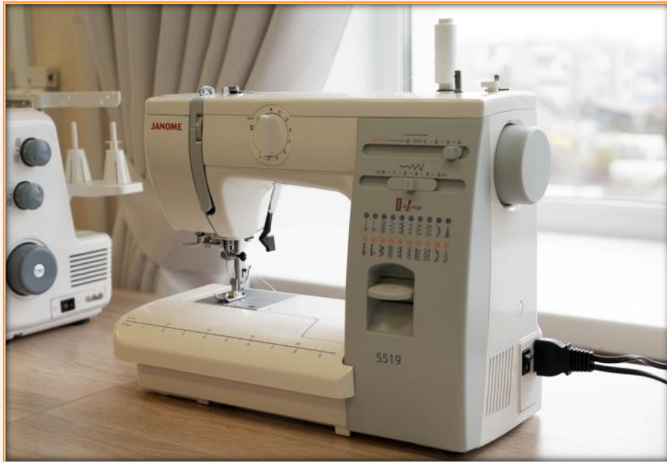
Машина швейная бытовая электромеханическая «JANOME»