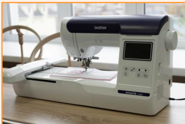
Машина-автомат вышивальная «BROTNER»