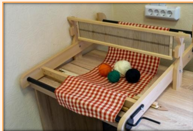
Бытовой ткацкий станок шириной 60 см